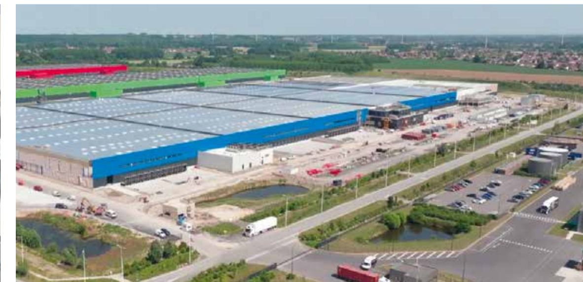
Vue du futur bâtiment logistique de 136 000 m 2 sur la plateforme multimodale de Douargues dans le Pas-de-Calais