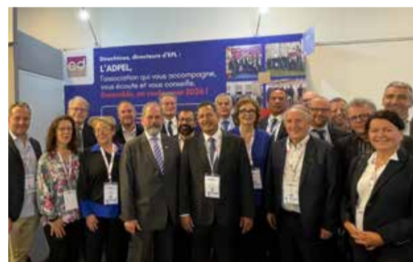
Inauguration du congrès des EPL