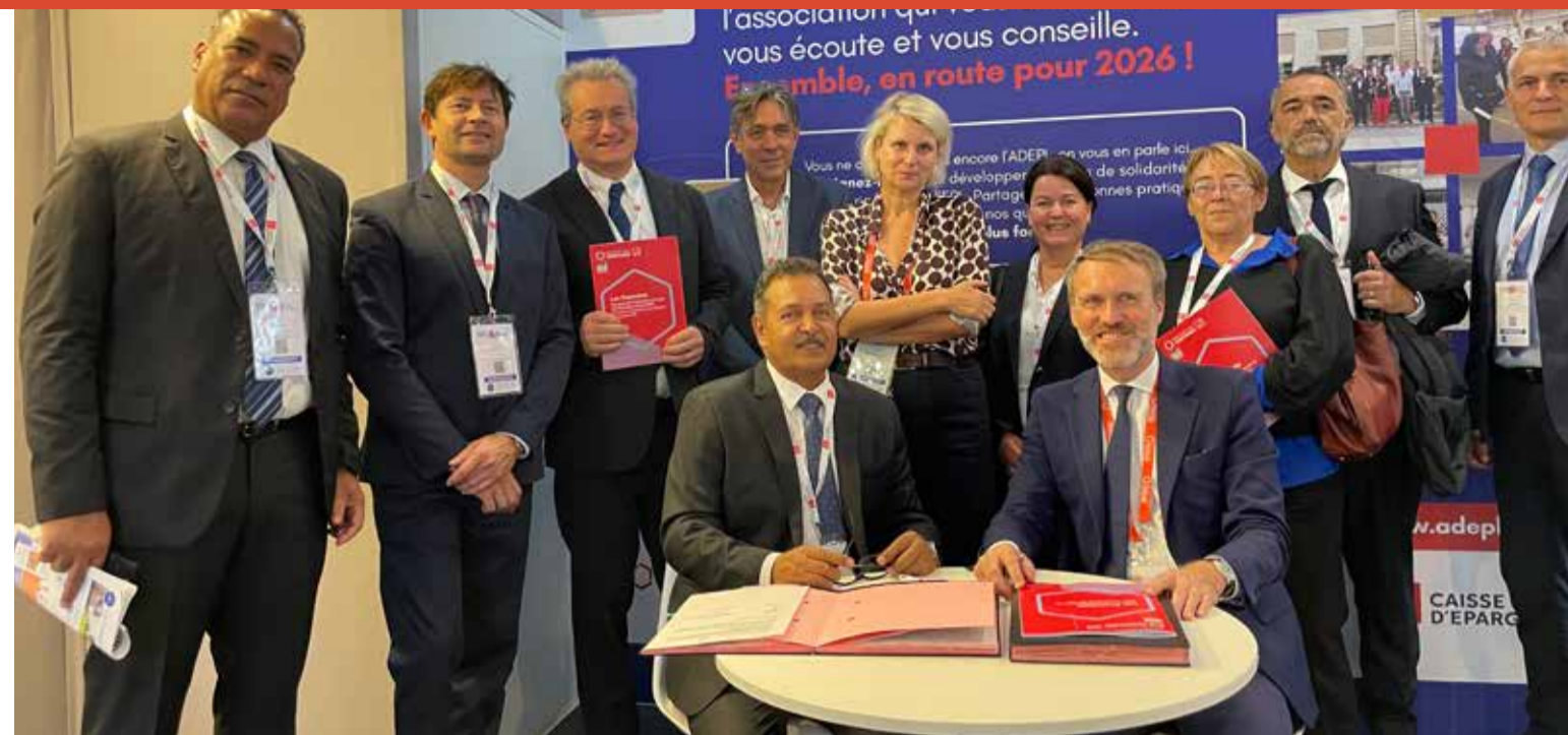
Signature du renouvellement de la convention de partenariat avec la Banque des Territoires